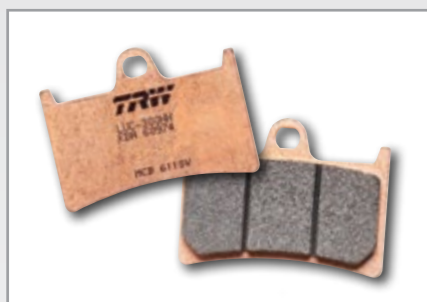
SV/SH SINTER STREET