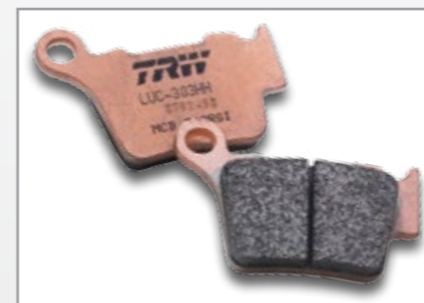
RSI SINTER OFFROAD