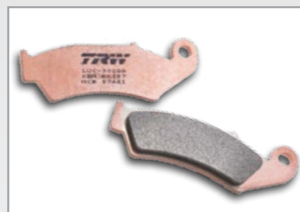
SI SINTER OFFROAD